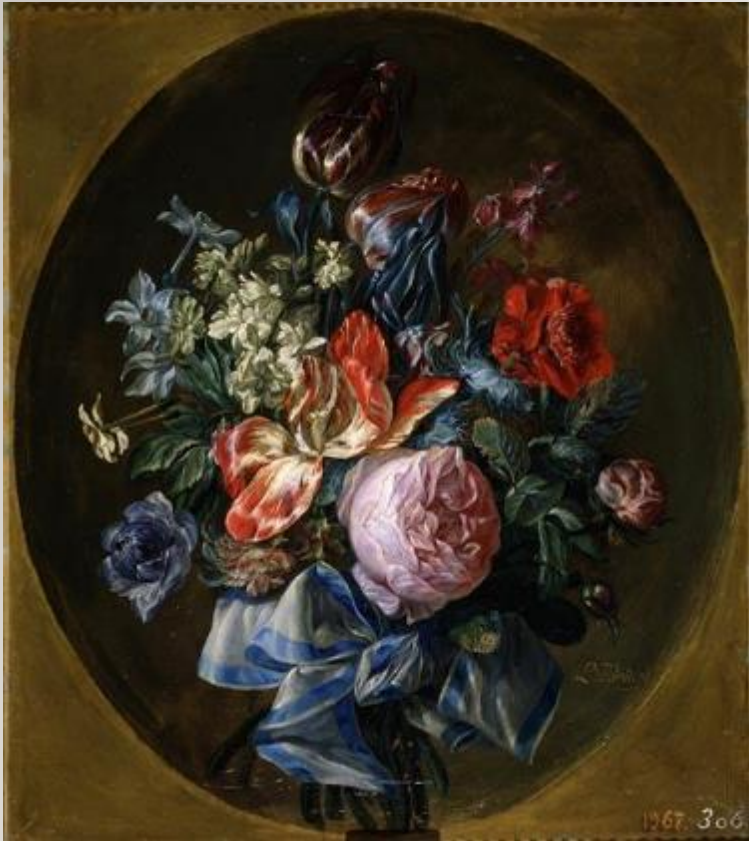
Ramillete de flores / Luis Paret y Alcázar Óleo sobre lienzo, 40.4 x 35.5 cm 1780 Madrid, Museo Nacional del Prado