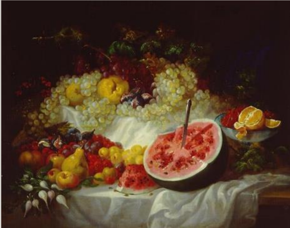
Bodegón / Eugenio Lucas Velázquez (1817 – 1870) Óleo sobre lienzo, 79 x 100 cm Madrid, Museo Nacional del Prado