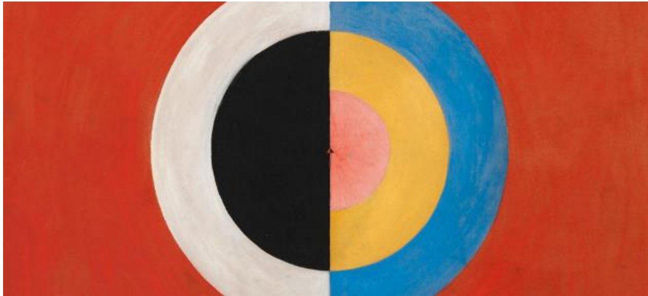
Hilma Klint . Svanen No. 17.