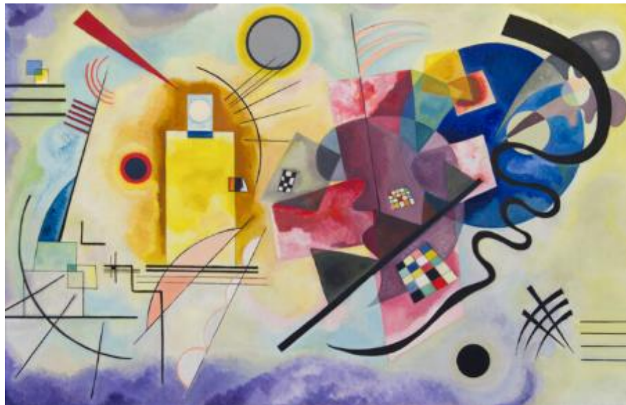
Wassily Kandinsky. Composición VII